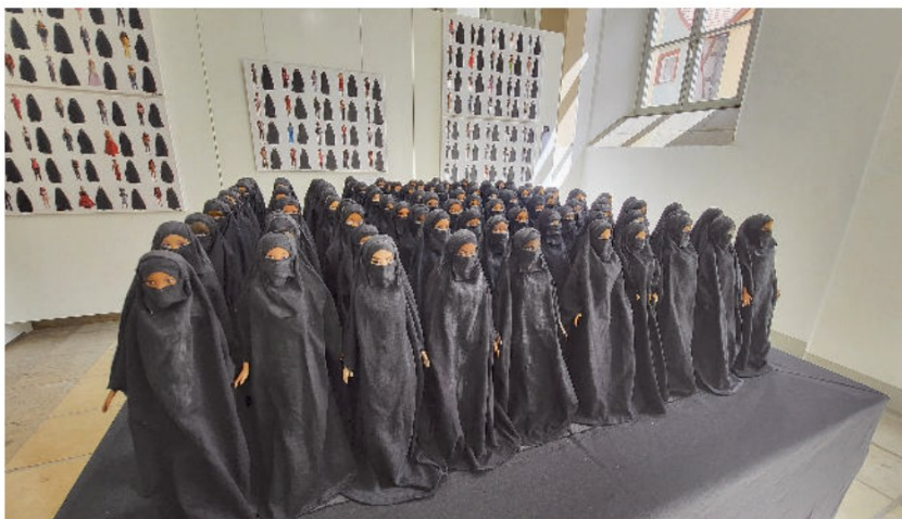
Beklemmendes Spielzeug: Die Installation von Sabine Reyer zeigt Barbie-Puppen, die in langen Gewändern und dem Gesichtsschleier Niqab verhüllt sind.