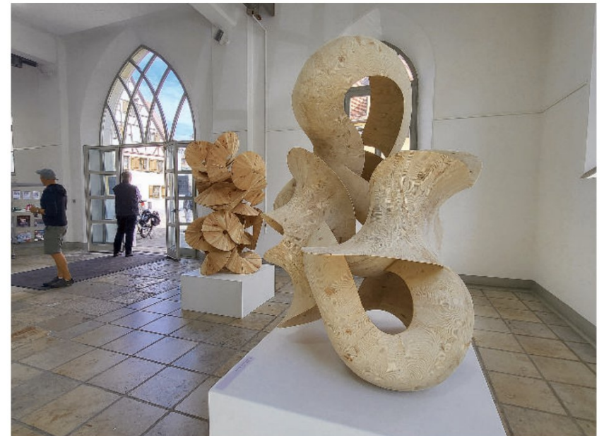
Ein Gemälde, kaum von einer Fotografie zu unterscheiden: eine Waldansicht von Jens Rausch.