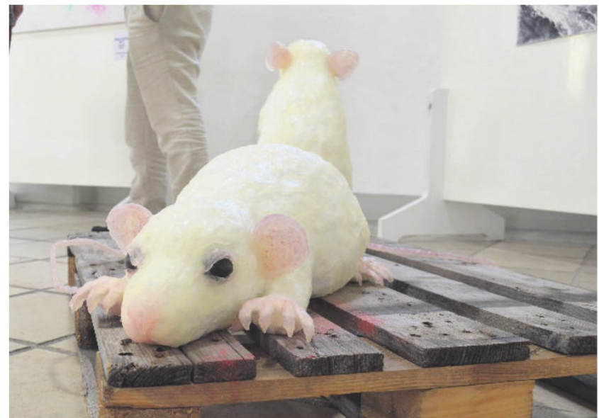
„Ekelig“, meint eine Umstehende. Die riesenhaften Ratten von Tanja Fender (München) können die Besucher bis in ihre Träume verfolgen oder einfach nur neugierig machen.