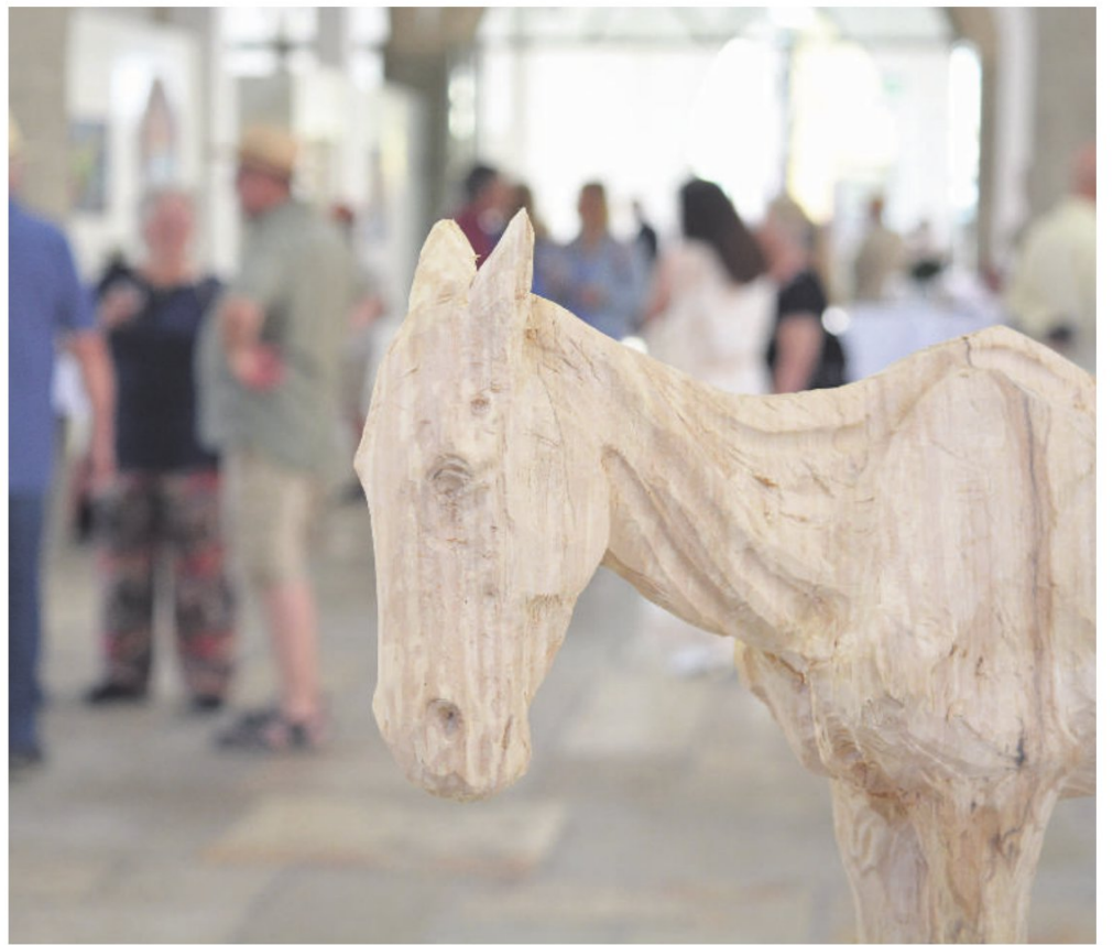
Ein ausgemergelter Tierkörper aus Holz: Die Skulptur beobachtet die Besucherinnen und Besucher der Kunst-Schranne.