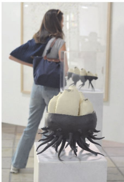
Was lösen die Skulpturen von Vera Bollenbach im Betrachter aus?